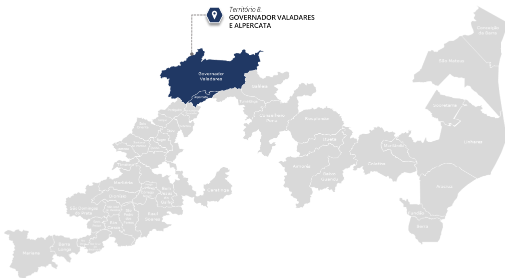
Mapa 1. Microterritório Governador Valadares e Alpercata

Governador Valadares e Alpercata estão localizados no macroterritório do Médio Rio Doce e, apesar da diferença de porte municipal, experimentaram impactos similares decorrentes do vazamento dos rejeitos no rio Doce. Os municípios, seus distritos e comunidades locais relatam insegurança a respeito da qualidade da água para consumo. Em períodos chuvosos, as enchentes provocam alagamento de casas ribeirinhas em Ilha Brava, e em Governador Valadares (sede). Neste último, somam-se os impactos na cadeia produtiva da pesca e agricultura, no comércio, turismo e extração de areia. O reservatório da Usina Hidroelétrica de Baguari não sofreu um processo de assoreamento tão grave quando o da UHE de Candonga, mas suas águas apresentaram níveis elevados de turbidez após o rompimento. A jusante da represa de Baguari, houve depósito de pluma de rejeitos na planície de inundação. Este trecho era o mais populoso do curso do rio, impactando no fornecimento de água à população de ambos os municípios. Em Alpercata, os danos do rompimento estão